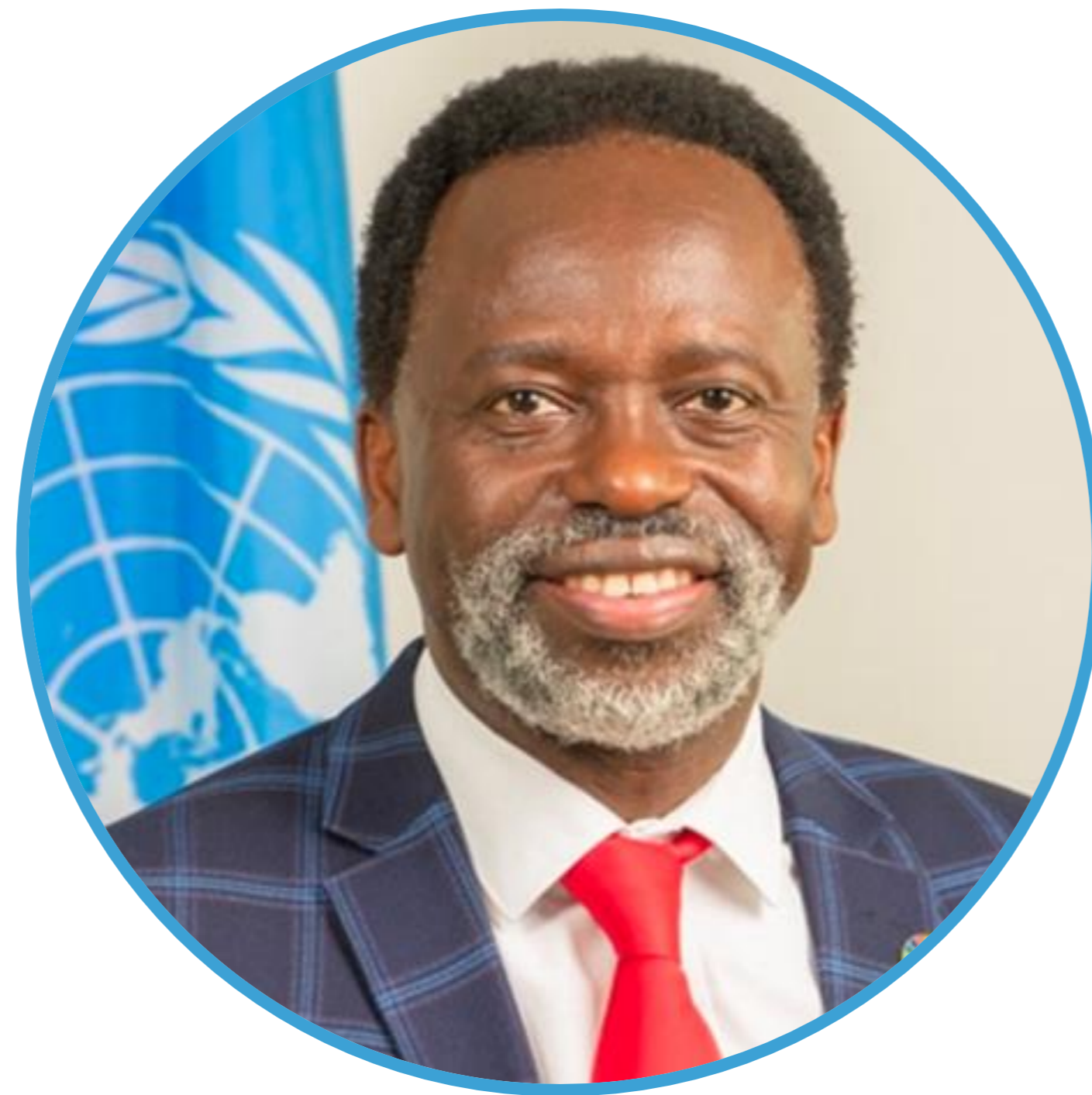
西里达兹·马尔瓦拉教授